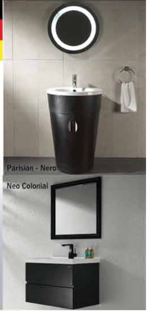
Parisian - Nero