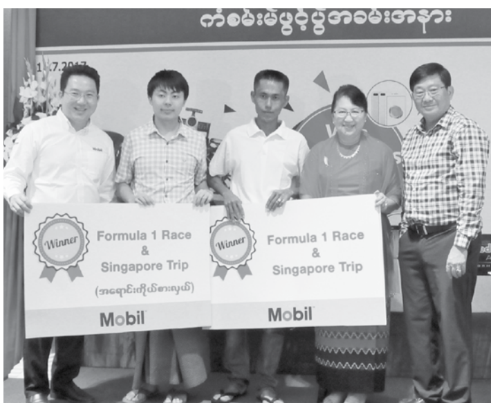
အမေရိကန်အခြေစိုက် ကမ္ဘာ တရားဝင် တင်သွင်းရောင်းချလျက်ရှိ ကျော် ရေနံကုမ္ပဏီတစ်ခုဖြစ်သော သည့် MJK & AKT Petroleum Co. Exxon Mobil ၏ ထုတ်ကုန်များကို Ltd., က Mobil အင်ဂျင်ပိုင်သုံးစွဲသူ