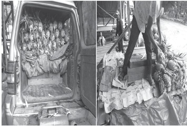
ယာဉ်(လိုင်စင်စိစစ်ဆဲ)နှင့် ယာဉ်အမှတ် 3C-7154 ပါဂျဲရီးယာဉ် (လိုင်စင်စိစစ် ဆဲ) တို့အားစစ်ဆေးစဉ် နာနတ်သီးများ အောက်၌ ဖုံးအုပ်သယ်ဆောင်လာ သည့် ကျွန်းသစ်များအား သိမ်းဆည်း ရမိခဲ့ကြောင်း သိရှိရပါတယ်။

လွယ်လျယ်ကုန်သွယ်ရေးစခန်း မှ ဒုတိယညွှန်ကြားရေးမှူး ဦးသန်းဇင်မင်း ဦးစီးသည့် OSS ကုန်သွယ်ရေးဦးစီးဌာန၊ OSS အကောက်ခွန်ဦးစီးဌာန၊ OSS မြန်မာနိုင်ငံရဲတပ်ဖွဲ့ဝင်သော ပူးပေါင်း အဖွဲ့သည် ဗန်းမော်မှ တစ်ဖက်နိုင်ငံသို့ တင်ပို့မည့် နာနတ်သီးများ တင်ဆောင် လာသည့် ယာဉ်များပေါ်၌ တရားမဝင် သစ်များ ဖုံးအုပ်သယ်ဆောင်လျက်ရှိ ကြောင်း သတင်းအရ ပို့ကုန်/သွင်းကုန် ယာဉ်များအား စနစ်တကျ ရှာဖွေ စစ်ဆေးဆောင်ရွက်လျက်ရှိရာ ဇူလိုင် လ ၁၆ ရက် ၁၅:၀၀ နာရီအချိန်ခန့်တွင် ဗန်းမော်မှ လွယ်လျယ်သို့ထွက်ခွာလာ သည့် ယာဉ်အမှတ် 9D-2408 ပါဂျဲရီး