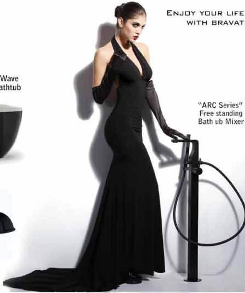
"ARC Series" Free standing Bath ub Mixer