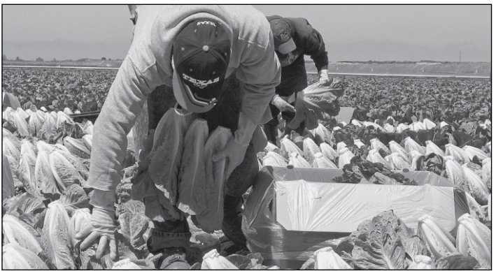
ကျသွားခဲ့ကြောင်း တရုတ်နိုင်ငံ လယ်ယာစိုက်ပျိုးရေး၊ အစားအစာနှင့် ကျေးလက်ရေးရာဝန်ကြီးဌာန၏ ထုတ်ပြန်ချက်ကို ကိုးကားပြီး ဆင်ဟွာသတင်း

တောင်ကိုရီးယားနိုင်ငံမှ လယ်ယာထွက်ကုန်များအား တရုတ်နိုင်ငံသို့ တင်သွင်းမှု လျော့ကျသွားကြောင်း ဆင်ဟွာသတင်းဌာနတွင် ဖော်ပြထားသည်။ တရုတ်နိုင်ငံသို့ လယ်ယာထွက်ကုန်နှင့်အစားအစာများအား တောင်ကိုရီးယားနိုင်ငံက တင်သွင်းလျက်ရှိရာ ဇန်နဝါရီလမှ ဇွန်လအထိ အမေရိကန်ဒေါ်လာ ၄၃၅ ဒသမ ၇ သန်းဖိုးအထိ တင်သွင်းခဲ့သည်။ သို့သော် အဆိုပါပမာဏသည် ပြီးခဲ့သည့်နှစ်ကာလထက် ၁၁ ဒသမ ၄ ရာခိုင်နှုန်းလျော့